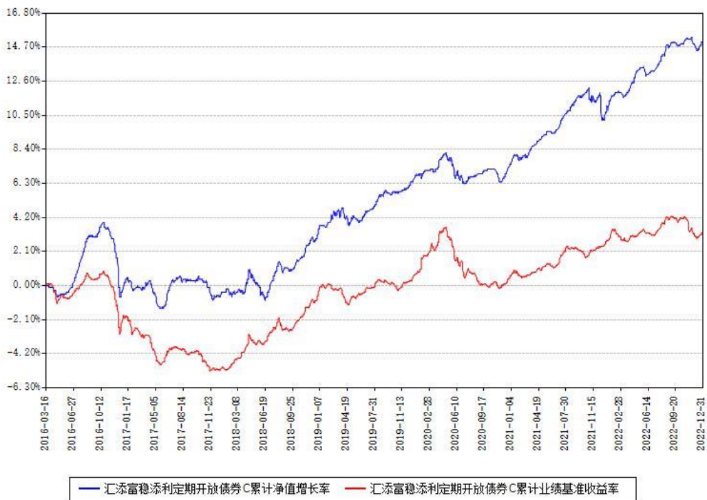
汇添富稳健添利定期开放债券C累计净值增长率与同期业绩基准收益率对比图