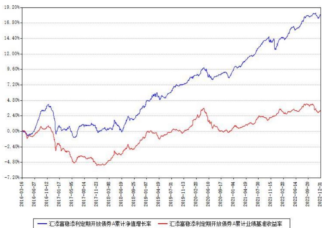
汇添富稳健添利定期开放债券A累计净值增长率与同期业绩基准收益率对比图