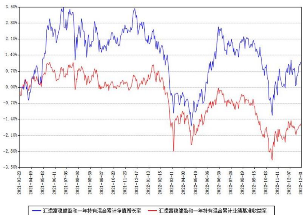
汇添富稳健盈和一年持有混合累计净值增长率与同期业绩基准收益率对比图