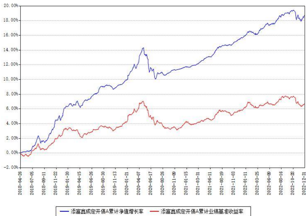
添富鑫成定开债A累计净值增长率与同期业绩基准收益率对比图