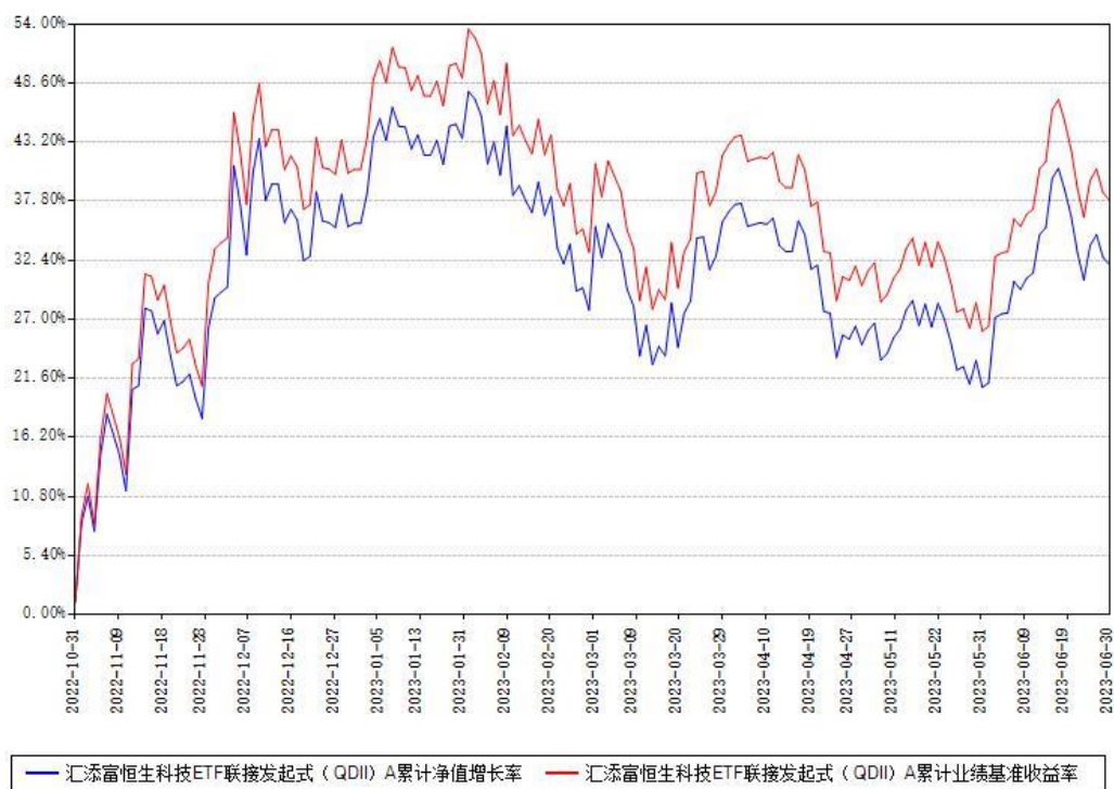
汇添富恒生科技ETF联接发起式（QDII）A累计净值增长率与同期业绩基准收益率对比图

(二) 自基金合同生效以来基金累计净值增长率变动及其与同期业绩比较基准收益率变动的比较图