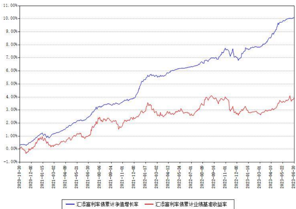
汇添富利率债累计净值增长率与同期业绩基准收益率对比图