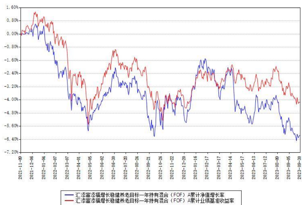
汇添富添福增长稳健养老目标一年持有混合（FOF）A累计净值增长率与同期业绩基准收益率对比图

(二)自基金合同生效以来基金累计净值增长率变动及其与同期业绩比较基准收益率变动的比较图