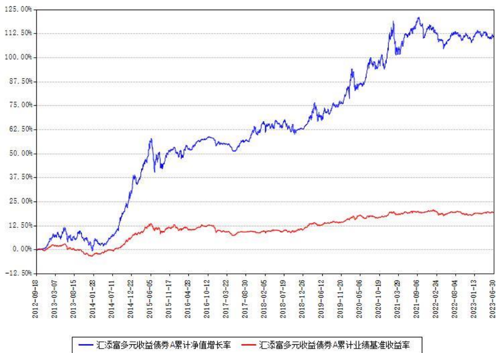
汇添富多元收益债券A累计净值增长率与同期业绩基准收益率对比图