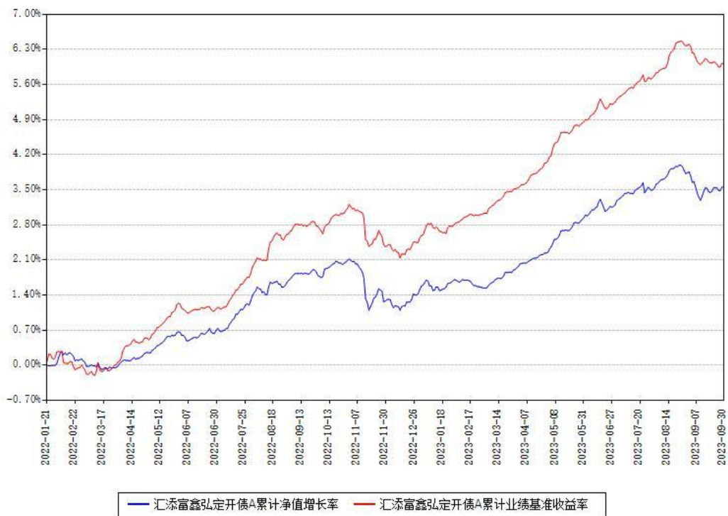
汇添富鑫弘定开债A累计净值增长率与同期业绩基准收益率对比图