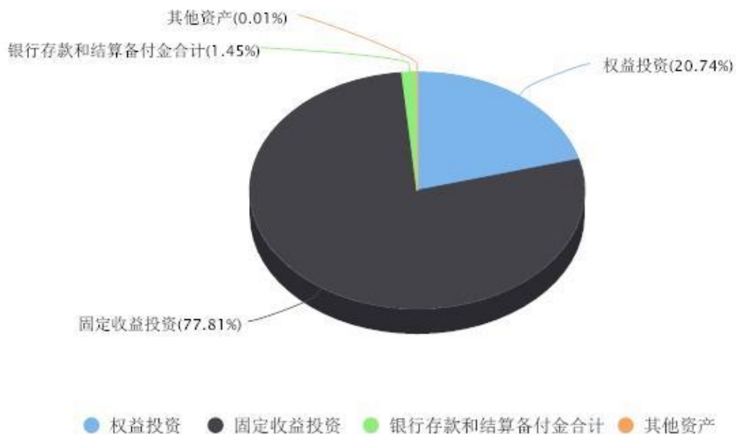
投资组合资产配置图表 数据截止日期:2023年12月31日