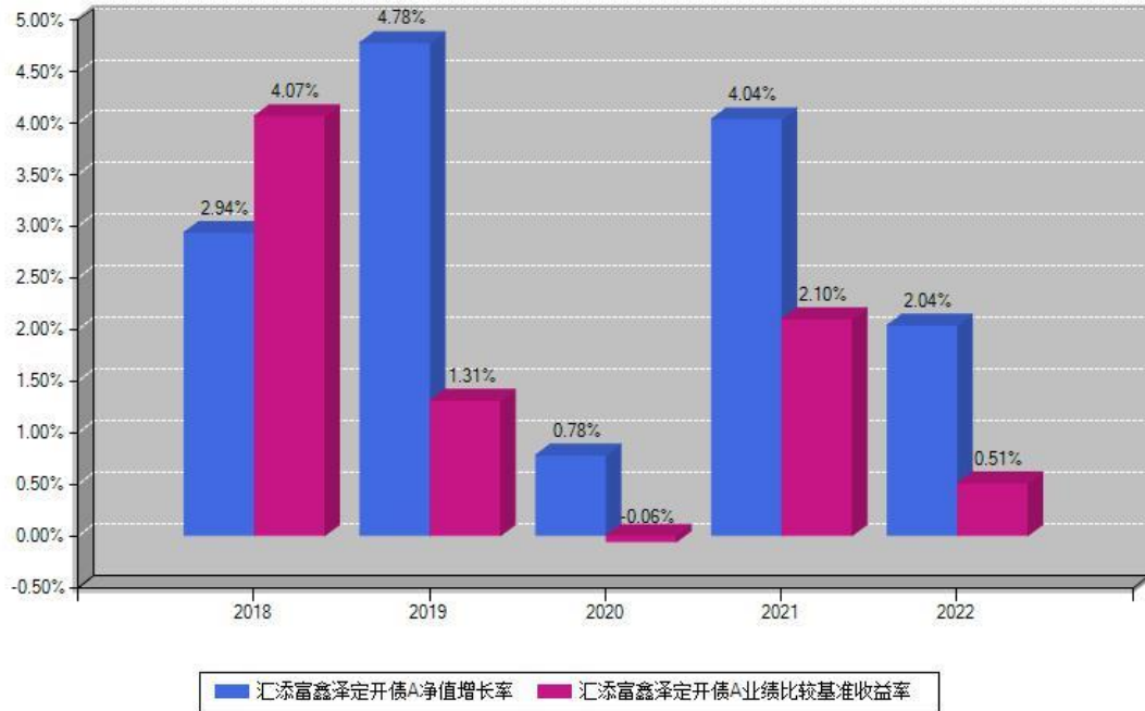
汇添富鑫泽定开债A每年净值增长率与同期业绩基准收益率对比图

注：基金的过往业绩不代表未来表现。本《基金合同》生效之日为2018年03月08日，合同生效当年按实际存续期计算，不按整个自然年度进行折算。