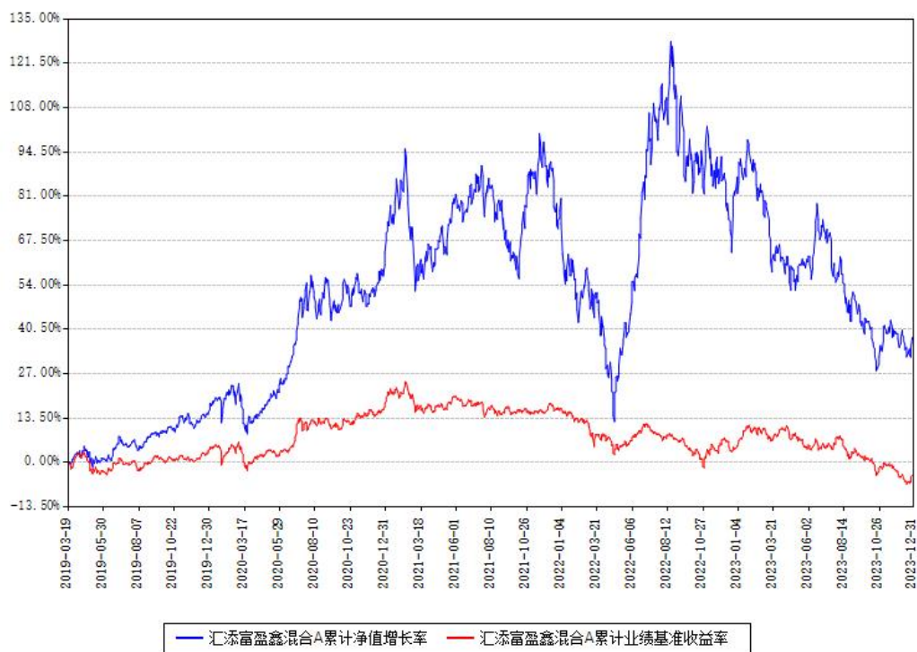
汇添富盈鑫混合A累计净值增长率与同期业绩基准收益率对比图