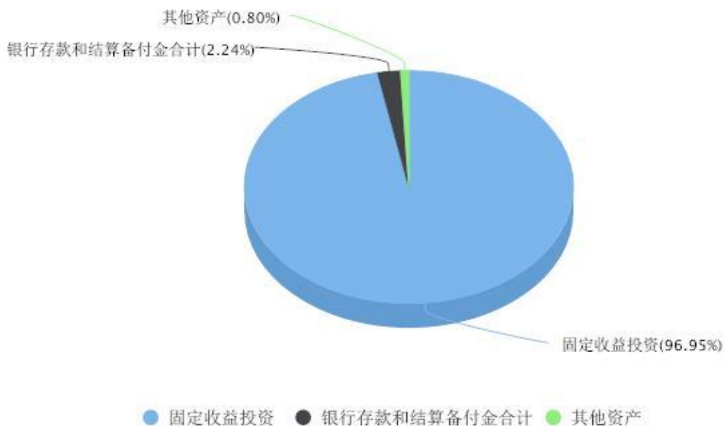
投资组合资产配置图表 数据截止日期:2023年12月31日