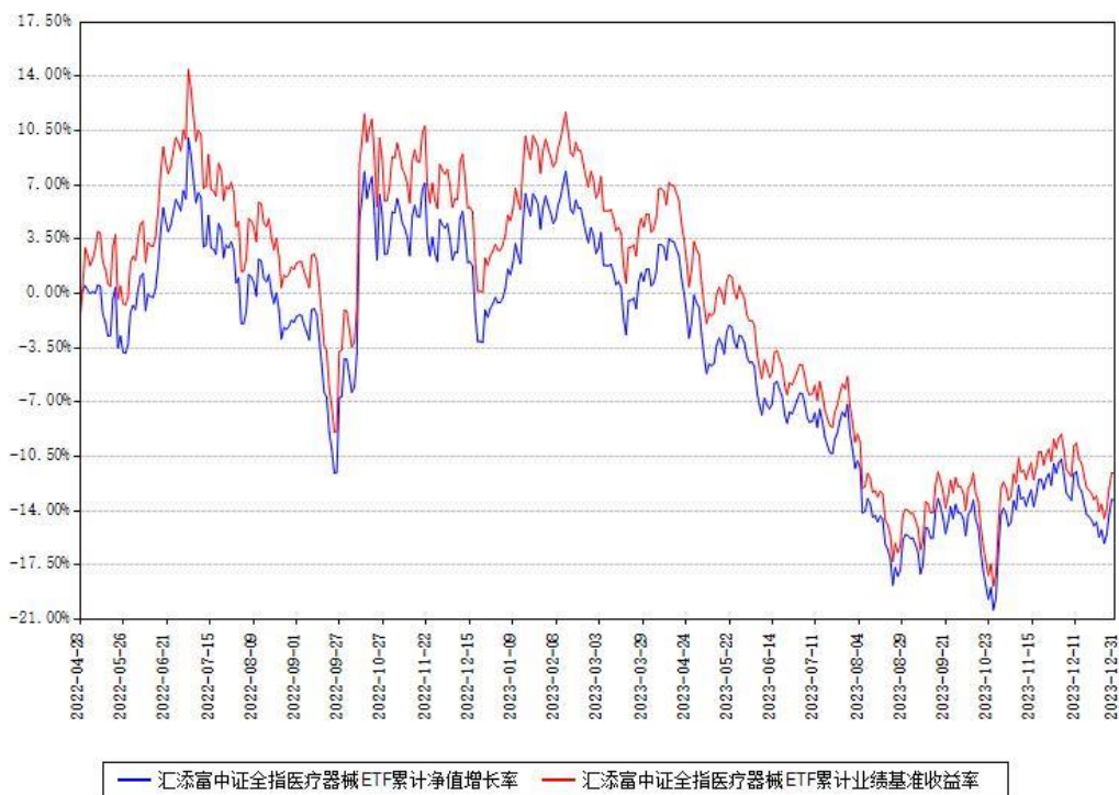
汇添富中证全指医疗器械ETF累计净值增长率与同期业绩基准收益率对比图

(二) 自基金合同生效以来基金累计净值增长率变动及其与同期业绩比较基准收益率变动的比较图