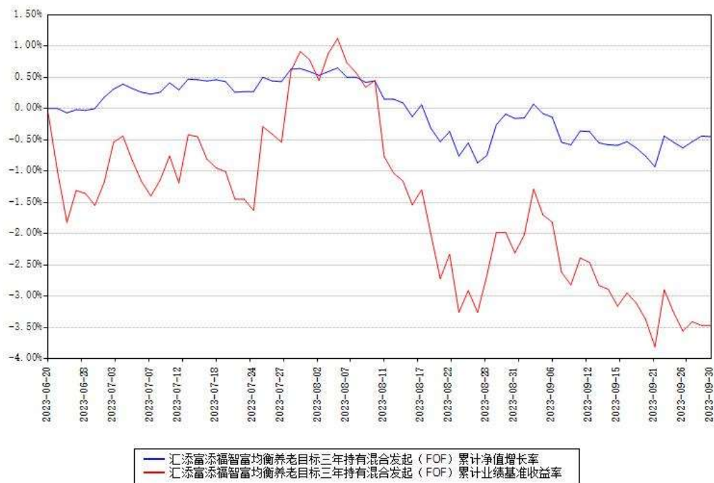
汇添富添福智富均衡养老目标三年持有混合发起（FOF）累计净值增长率与同期业绩基准收益率对比图