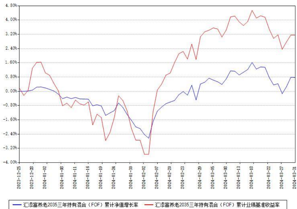
汇添富养老2035三年持有混合（FOF）累计净值增长率与同期业绩基准收益率对比图