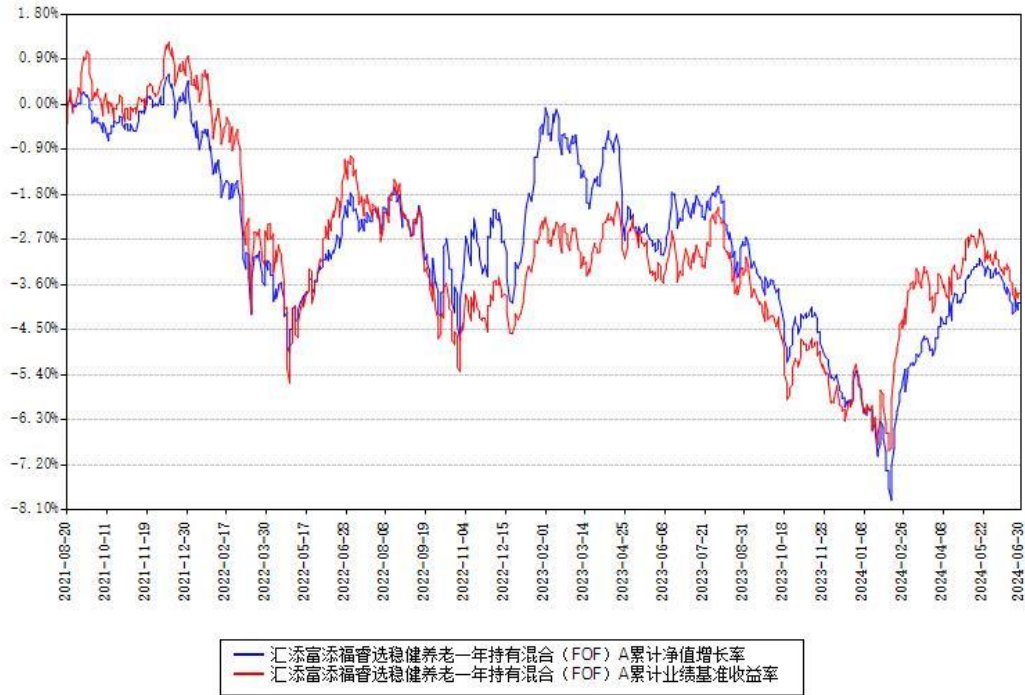
汇添富添福睿选稳健养老一年持有混合 (FOF) Y 累计净值增长率与同期业绩基准收益率对比图