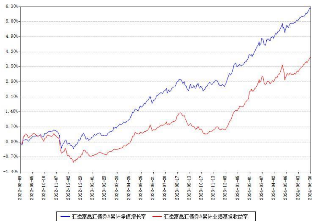
汇添富鑫汇债券A累计净值增长率与同期业绩比较基准收益率对比图