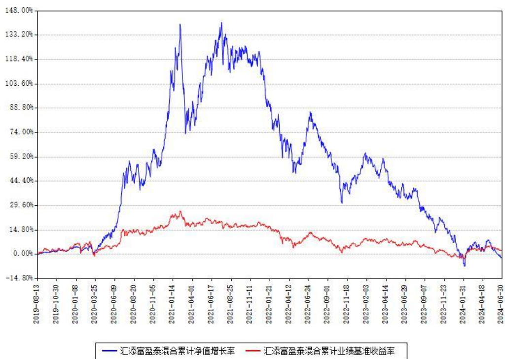
汇添富盈泰混合累计净值增长率与同期业绩基准收益率对比图