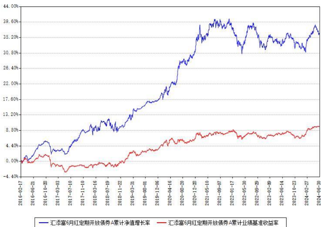
汇添富6月红定期开放债券A累计净值增长率与同期业绩基准收益率对比图