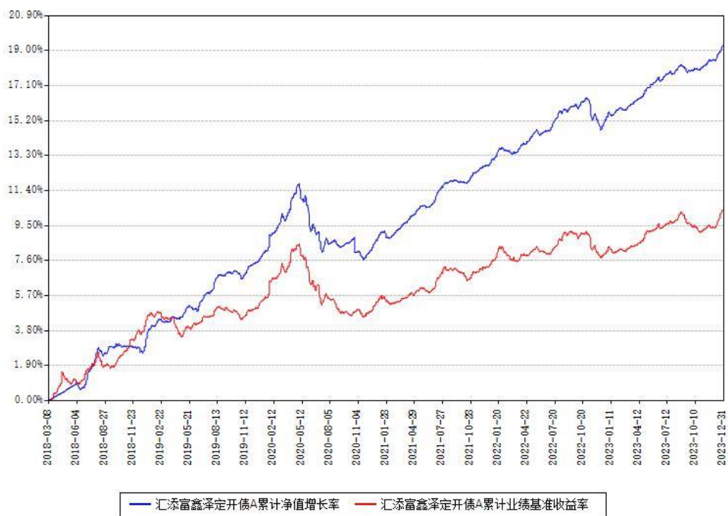
汇添富鑫泽定开债A累计净值增长率与同期业绩基准收益率对比图