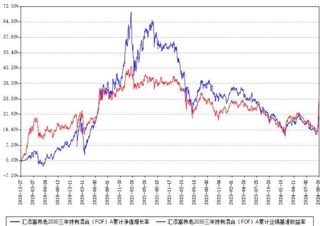
汇添富养老2030三年持有混合（FOF）A累计净值增长率与同期业绩基准收益率对比图

(二)自基金合同生效以来基金累计净值增长率变动及其与同期业绩比较基准收益率变动的比较图