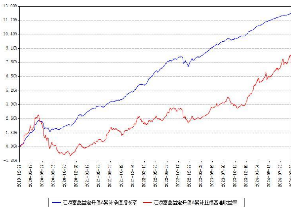
汇添富鑫益定开债A累计净值增长率与同期业绩基准收益率对比图