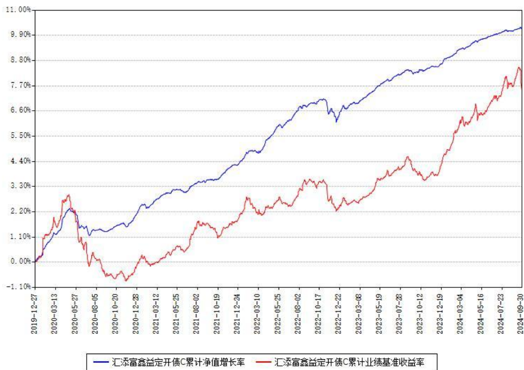
汇添富鑫益定开债C累计净值增长率与同期业绩基准收益率对比图