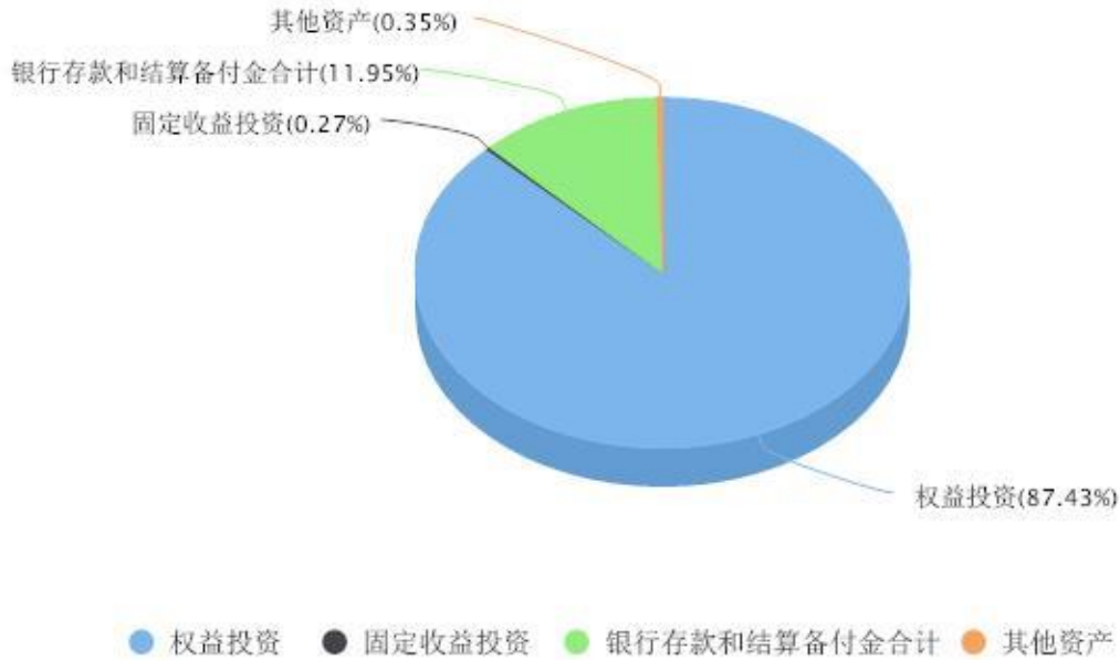
投资组合资产配置图表 数据截止日期:2024年06月30日